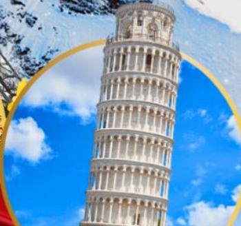
หออนปีซ่า