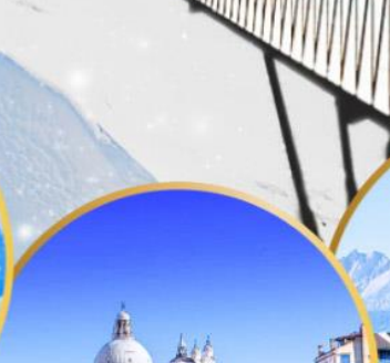
ล่องเรือสู่เกาะเวนิส