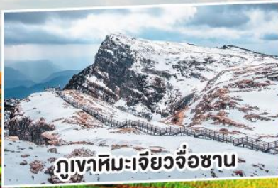
ภูเขาหิมะเจียวจื่อซาน