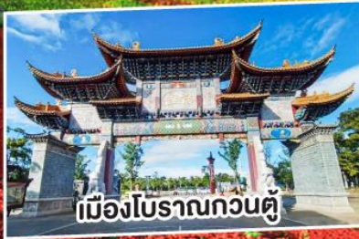
เมืองโบราณกวนตุ๋