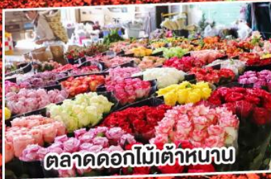
ตลาดดอกไม้เต๋านาน