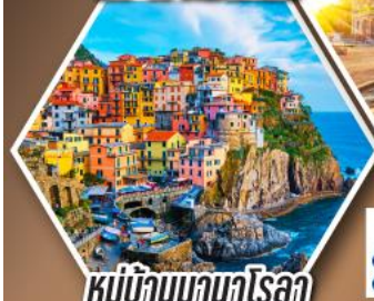
หมู่บ้านมานาโรลา