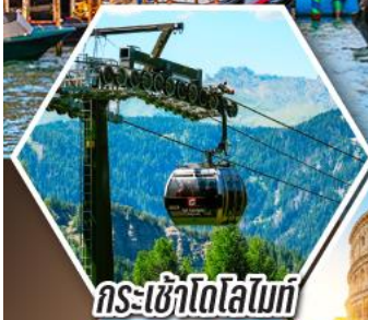
กระเช้าโดโลไมท์