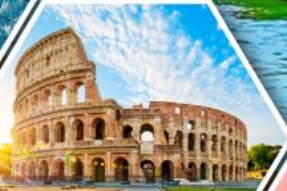
โคลอสเซียม