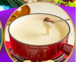
ฟองดูชีส