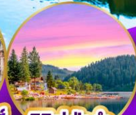
ทิกเกิ์ ปาดำ