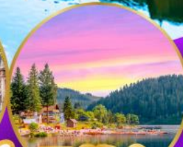
ทิกเกิเซ่ ปาดำ