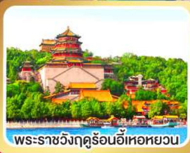
พระราชวังฤดูร้อนอ้อหอยวน