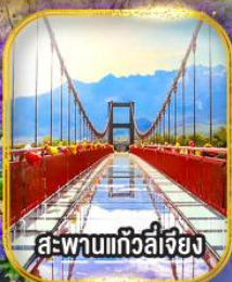
สะพานแกวี่ลี่เจียง