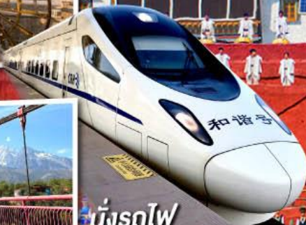
นั่งรถไฟ ความเร็วสูง