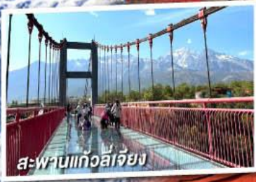
สะพานแก้วลี่เจียง