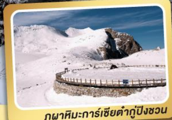
ภูเขาสีดรุณีท่ากู่ปิงชวณ