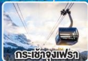
กระเช้าจุ่งเฟร่า