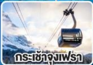
กระเช้าจุ่งเฟร่า

เข้าแวร์ซายน์ เทียวลูเซิร์น เดินเพลินๆ เดินไปสวยไป ฝรั่งเศสและสวิตเซอร์แลนด์ 8 วัน 5 คืน