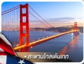
สะพานโกลเดนเกต

★ เยือนอุทยานเกรนด์แคนยอน ฝั่ง South rim ความมหัศจรรย์ทางธรรมชาติ ที่ยิ่งใหญ่ที่สุดแห่งหนึ่งของโลก