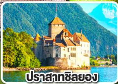
ปราสาทชิลยอง