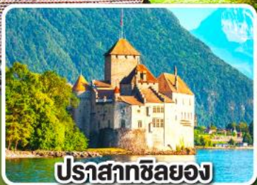
ปราสาทชิลยอง