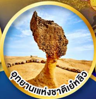
อุทยานแห่งชาติเย้หลิว