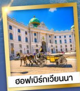
ออฟเบิร์กเวียนนา

เข้าชมความงดงามภายใน ของปราสาทนอยชวานสไตน์