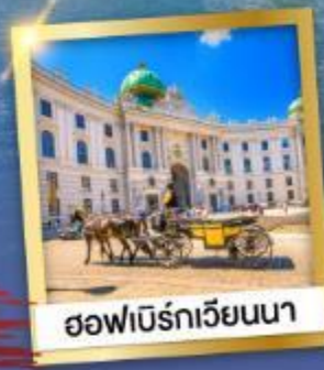
ฮอฟบิรท์เวียนนา