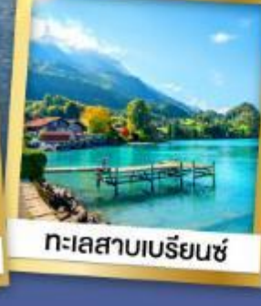
ทะเลสาบเบรียนด์