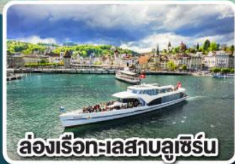
ล่องเรือทะเลสาบลูเซิร์น

เที่ยวครบเส้นทาง Jewels of Romantic Europe ของบาวาเรียและทีโรล