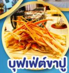
บุฟเฟ่ต์ฆาบู