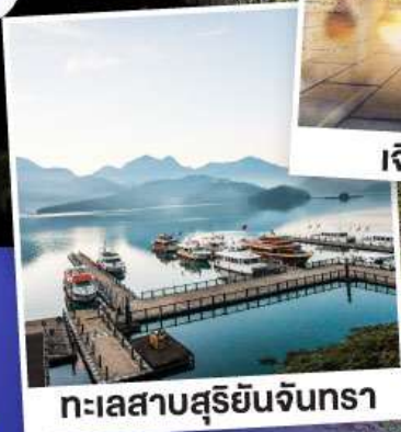
ทะเลสาบสุริยอันจันตรา