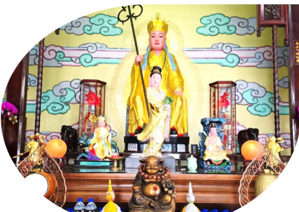
แนะนำ... ของเด็ด ที่ Sun Moon Lake

สุริยันและทะเลสาบจันทรา สร้างขึ้นในปี ค.ศ. 1955 ภายในประดิษฐานพระพุทธรูปทองคำของพระภิกษุเสวียนจั้ง นักปราชญ์แห่งราชวงศ์ถัง ผู้เดินทางไปอินเดียเพื่ออัญเชิญพระไตรปิฎกกลับมาจีนตามพระบัญชาจักรพรรดิ ด้านหน้าวัดมีท่าเรือเล็กๆ ริมทะเลสาบ พร้อมบันไดขึ้นสู่วัดโดยมีฉากหลังเป็นภูเขางดงาม บรรยากาศร่มรื่น เหมาะแก่การถ่ายภาพและสักการะสิ่งศักดิ์สิทธิ์ พร้อมข้อความใต้พระรูปว่า “ปราชญ์ผู้ยิ่งใหญ่แห่งชาติ” เป็นอีกหนึ่งจุดแวะสำคัญบนเส้นทางแห่งศรัทธาในเมืองหนานโถว