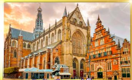
จัตุรัสเมืองฮาร์เล็ม

พรมแดนเมืองเปลาเกเนเธอร์แลนด์และเบลเยียม เดินเมืองเคลฟท์ เมืองเครื่องปั้นดินเผาระดับโลก ฮาร์เล็มเมืองมั่งคั่งที่สุดของเนเธอร์แลนด์