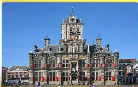
อาคารเมืองเก่าคลองเมืองเคลฟท์