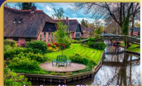
ล่องเรือหมู่บ้านไรกนทึร์ฮูส