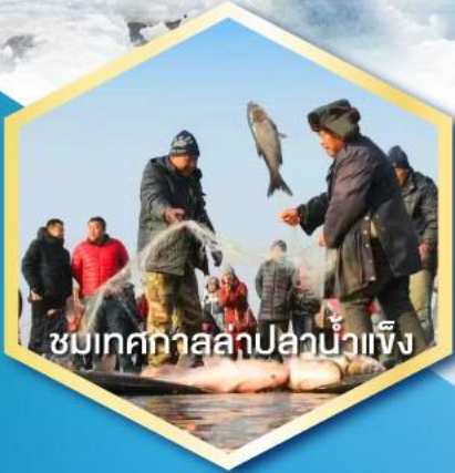
ชมเทศกาลปลาแม่น้ำเข็ง

ฟรี ถุงมือ หมวก ผ้าพันคอและถุงร้อน ท่านละ 1 ชุด !!