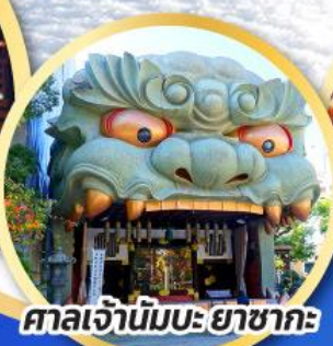
ศาลเจ้านิมะ ยาชากะ