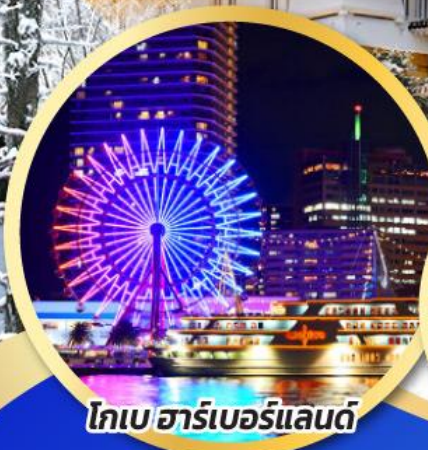
โกเบ ฮาร์เบอร์แลนด์