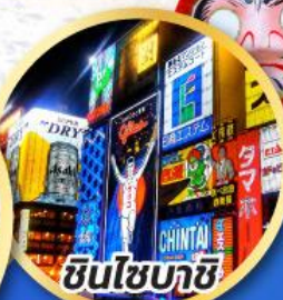
ชินโซบาชิ