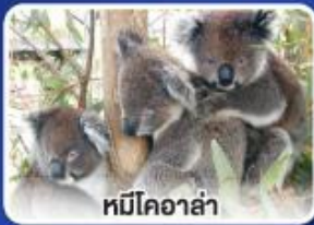
หมีโคอาลา