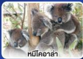
หมีโคอาลา