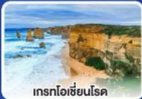
เกรทโอเซียนโรค