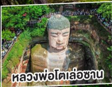
หลวงพ่โตเล่อซาน