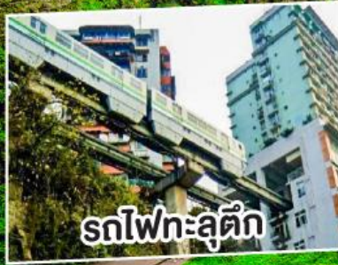
รถไฟเหาะตุ๊ก