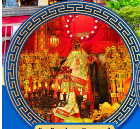
วัดเจ้าแม่กวนอิมของฮ่า