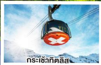
กระเช้าทิตลิส