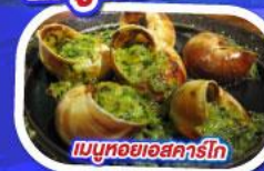
เมนูหอยออสการ์โท

ทานอาหาร ณภัตตาคารบนหอไอเฟล พร้อมชมวิวแสนโรแมนติก เมนูหอยแมลงภู่อัปโฌงัว