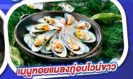
เมนูหอยแมลงภู่อัปโฌงัว