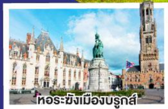
หอรบั้งเมืองบรูจส์