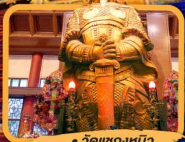
• วัดแซกงหมิว