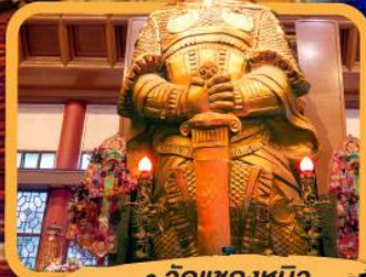
• วัดเซกตงหนิว