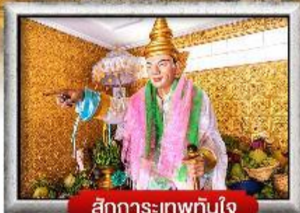
สักการะเทพทันใจ