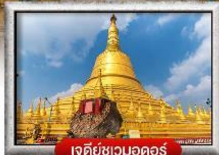
เจดีย์ชเวมอดอร์

เมนู สุดพิเศษ | กุ้งแม่น้ำเผา + บุฟเฟ่ต์นานาชาติ