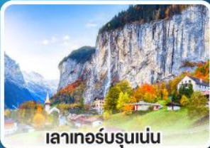
เลาเทอร์บรุนเนน