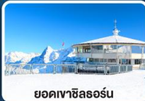
ยอดเขาซิลธอร์น