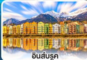
อินส์บรุค