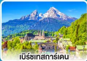
เบิร์ชเทสการ์เดน