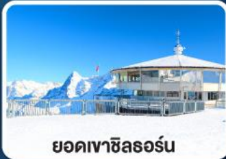
ยอดเขาซิลรอน

เข้าชมความสวยงาม พระราชวังเฮเรียนเคียมเซ่ "แวร์ซายน์แห่งเยอรมนี"