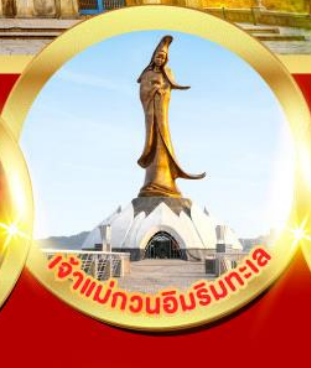
เจ้าแม่ทวนอิมริบทะเล