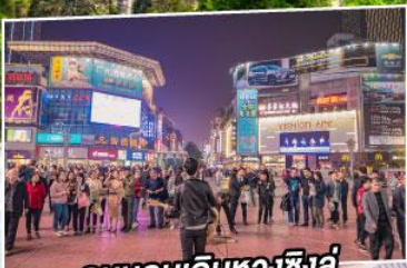
ถนนคนเดินหวงซิงลู่