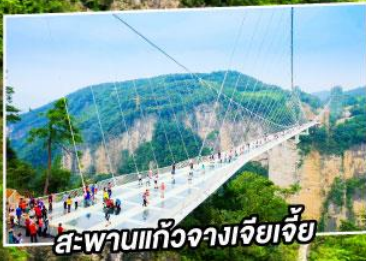
สะพานแกว่งจางเจียเจีย