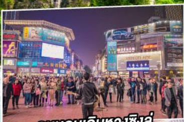
ถนนคนเดินหวงชิ่งลู่