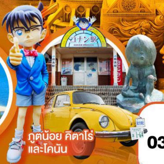
กูดน้อย คิตาโร่ และโคนัน