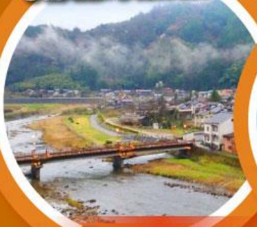
มิซาซาออนเซน

เที่ยวเต็มทุกวันไม่มีฟรีคีย์ ชมเนินทรายทตริที่ใหญ่ที่สุดในญี่ปุ่น ตามรอยกูดน้อย คิตาโร่ และโคนัน นั่งกระเช้าชมวิว 1 ใน 3 ที่สวยที่สุดในญี่ปุ่น “อามาโนะ ฮาชิคาตะ”