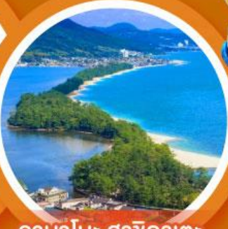
อามาโนะ ฮาชิคาตะ