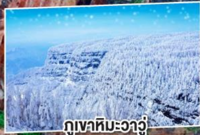
ภูเขาหิมะวางู๋