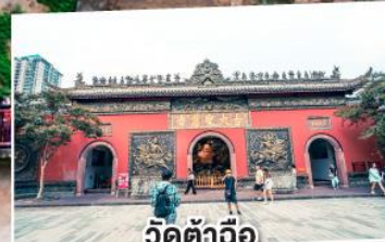
วัดต้าฉือ