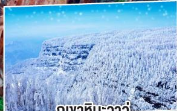
กูเอาหิมะขาว