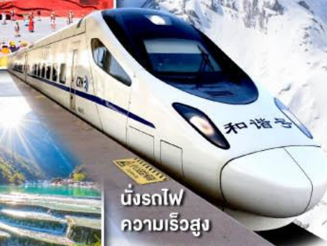
นั่งรถไฟ ความเร็วสูง