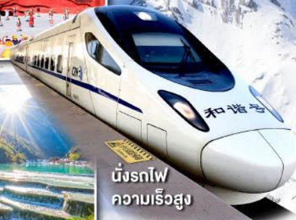
มังกรไฟ ความเร็วสูง