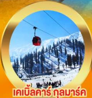
เคเบิลคาร์ กุลมาร์ค