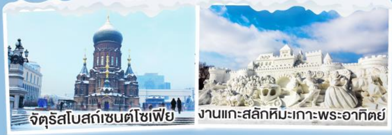
จัตุรัสโบสถ์เซ็นต์โซเฟีย