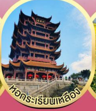
หวัทระเรี่ยนหลือฉง