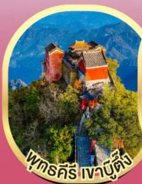
พุทธคีรี เจาบูตึง