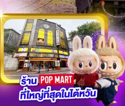
รับ POP MART ที่ใหญ่ที่สุดในไต้หวัน