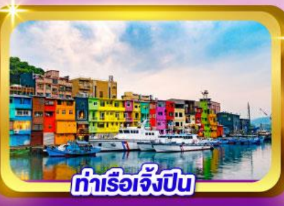
ท่าเรือเจิ้งปิง