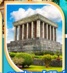
สุสานประธานโฮจิมินห์