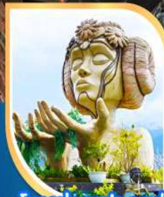
โมนาน่า ซาปา คาเฟ่