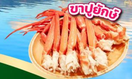
บาปูยกชิ