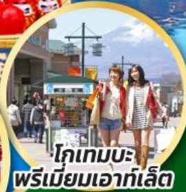
โกเทมบะ-พรีเมียมเอาก์เล็ท