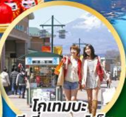
โทเกมะ-พรีเมียมเอาก์เล็ด