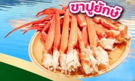
ซาปูยักซ์