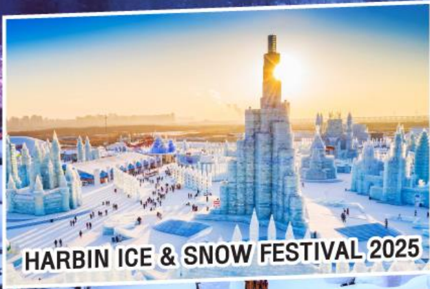
HARBIN ICE & SNOW FESTIVAL 2025