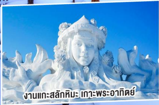
งานแกะสลักหิมะ เทวพระอาทิตย์