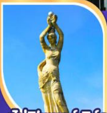
จูไห่พีซเซอร์กิส