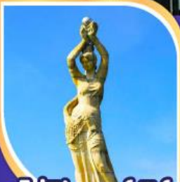
จูโห้ฟิชเซอร์เกิร์ล