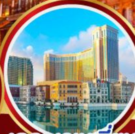
เดอะเจเนชั่น