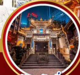
วัดหลิวอัน