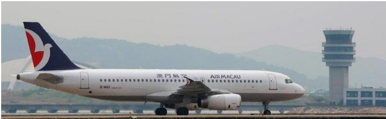
GO1CKG-NX001 เที่ยวบิน 2 เมือง มาเก๊า มหานครฉงชิ่ง อุ๋หลง ต้าจู้ เซ็คอินครบทุกจุดไฮต์ไลท์ 7 วัน 5 คืน (NX)

02. 45 น. ออกเดินทางสู่ มาเก๊า โดย สายการบินแอร์มาเก๊า เที่ยวบินที่ NX989 (NX 989 02.45 – 06.25) มีบริการอาหารและเครื่องดื่มบนเครื่อง