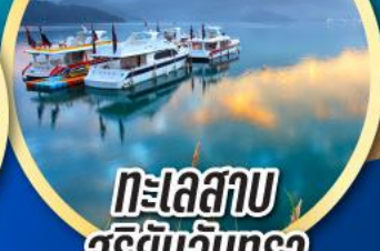
ทะเลสาบ สุริยันจันทรา

เมนูพิเศษ!! ต้มชาสโตล์ฮ่องกง เป้าอ้อ+ไวน์แดง, ปลาประธนาธิบดี