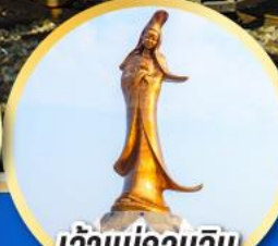
เจ้าแม่กวนอิม ริมทะเลมาเก๊า