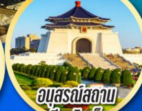
อนุสรณ์สถาน เจียงไคเช็ค