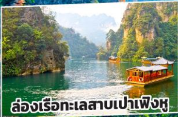
ล่องเรือทะเลสาบเป่าเฟิ่งหู