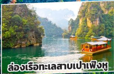
ล่องเรือทะเลสาบเป่าเฟิ่งหู