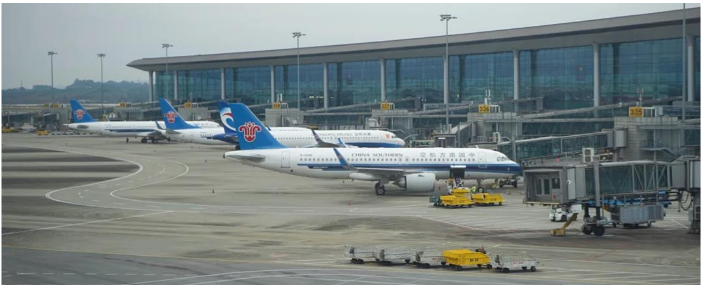
2UCKG-CZ005 บินตรงฉงชิ่ง ฟรีคอม ฟรีเดย์ สนุกสุดคุ้ม มหานครแปดมิติ 5 วัน 3 คืน โดยสายการบิน ไชน่า เซาเทิร์น (CZ)

00.30 น. ออกเดินทางจาก ท่าอากาศยานสุวรรณภูมิ อาคาร สู่ สนามบินฉงชิ่งเจียงเป่ย์ โดยสายการบิน ไชน่า เซาเทิร์น เที่ยวบินที่ CZ2362 05.00 น. เดินทางถึง ท่าอากาศยานนานาชาติสนามบินฉงชิ่ง เจียงเป่ย์ เมืองฉงชิ่ง มหานครที่ถูกสร้างขึ้นโดยทำหายทุกกฎเกณฑ์ของแรงโน้มถ่วงและภูมิศาสตร์ "เมืองภูเขา" ที่เติบโตและซ้อนทับกันเป็นชั้นๆ ตามหุบเขาและริมแม่น้ำ จนได้รับสมญานามสมัยใหม่ว่าเป็น "มหานคร 3 มิติสุดมหัศจรรย์" เมืองที่ท่านจะรู้สึกเหมือนหลุดเข้าไปในฉากภาพยนตร์ไซไฟ ที่ซึ่งชั้น 1 ของตึกหนึ่งอาจเชื่อมต่อกับชั้น 20 ของตึกข้างๆ, ที่ที่ท่านจะได้เห็นรถไฟฟ้าวิ่งทะลุกลางตึกอพาร์ทเมนต์, และที่ที่ Google Maps อาจต้องยอมแพ้ให้กับความซับซ้อนของถนนหนทางที่สร้างทับกันไปมาถึง 5 ระดับ จากนั้นนำท่านผ่านขั้นตอนตรวจคนเข้าเมือง รับกระเป๋าสัมภาระแล้ว นำท่านออกเดินทางเข้ารับประทานอาหารเช้า