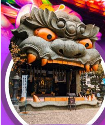
ศาลเจ้านิมบะ ยาชากะ