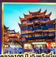
ตลาด 100 ปี เติ้งหวังเมี่ยว