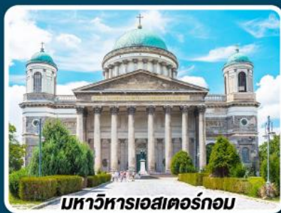
มหาวิหารเอสเตอร์กอม