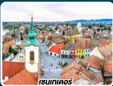
เชนเทเดอร์