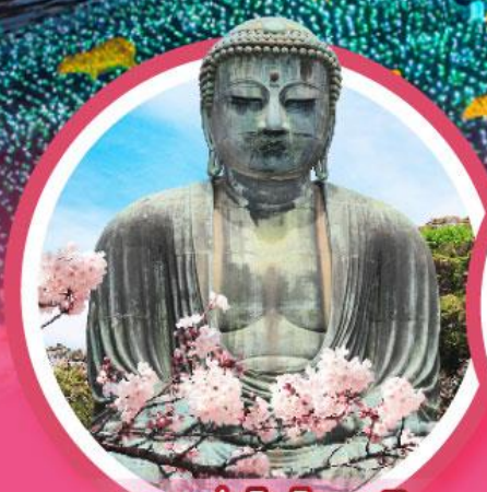
หลวงพ่อดาไคบุตสึ