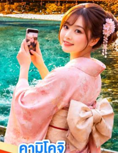
คาบิโดจิ