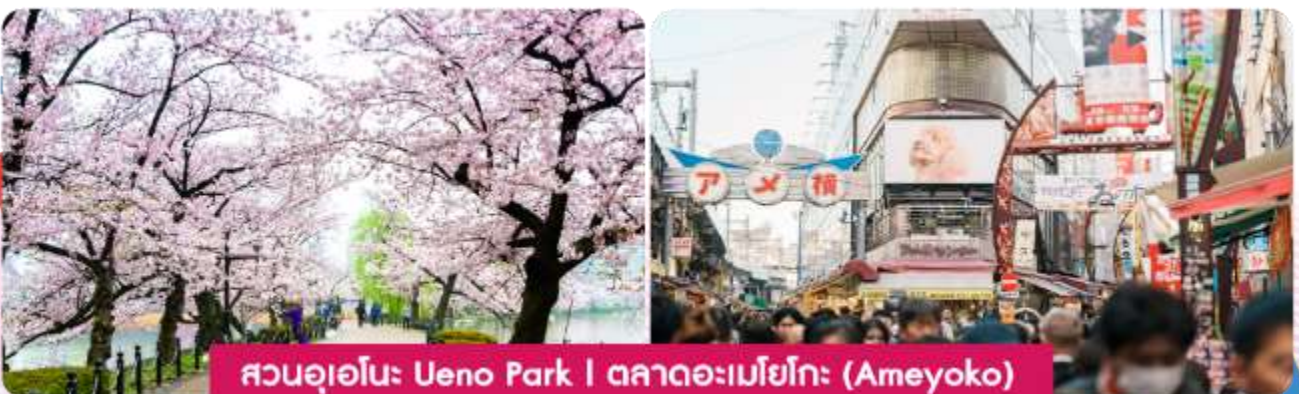
สวนอุเอโนะ Ueno Park | ตลาดอะเมโยโกะ (Ameyoko)

พาทุกท่านสู่ สวนอุเอโนะ (Ueno Park) สวนสาธารณะที่มีชื่อเสียงในกรุงโตเกียวมีสิ่งน่าสนใจมากมาย เช่น สวนสาธารณะ พื้นที่สีเขียวที่เหมาะสมแก่การเดินเล่นและพักผ่อน มีพิพิธภัณฑ์ที่มีชื่อเสียง เช่น พิพิธภัณฑ์โตเกียวแห่งชาติ และพิพิธภัณฑ์ศิลปะอุเอโนะ มีสวนสัตว์อุเอโนะ สวนสัตว์เก่าแก่และมีสัตว์หลากหลายชนิด รวมถึงทะเลสาบชินจิ ซึ่งมีกิจกรรมเรือพายให้ทำ และชมวิวดูได้อย่างสวยงาม และสวนอุเอโนะยังเป็นจุดชมดอกซากุระที่สวยงามในช่วงฤดูใบไม้ผลิ ตลาดอะเมโยโกะ (Ameyoko) เป็นตลาดชื่อดังในย่านอุเอโนะ ตลาดแห่งนี้เต็มไปด้วยร้านค้าต่างๆ ทั้งขายอาหารสด อาหารแปรรูป เสื้อผ้า เครื่องสำอาง และของที่ระลึก รวมถึงสินค้าราคาถูกหลายประเภท ทำให้เป็นแหล่งช้อปปิ้งยอดนิยมทั้งสำหรับคนท้องถิ่นและนักท่องเที่ยว