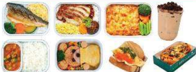
** ภาพเมนูตัวอย่าง รายการอาหารอาจเปลี่ยนแปลงได้ตามช่วงเวลา