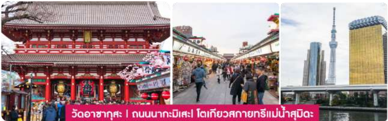
วัดอาซากุสะ | ถนนนากะมิสะ | โตเกียวสกายทรีแม่น้ำสุมิเดะ

เช้า : รับประทานอาหารเช้า ณ ห้องอาหารโรงแรม