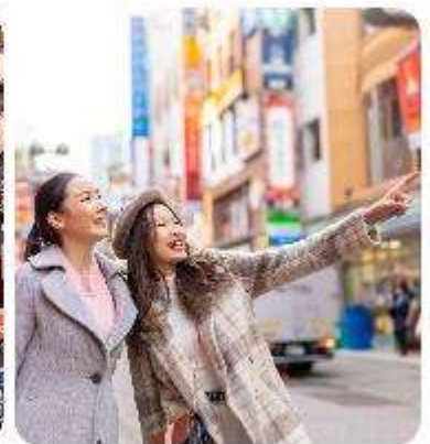
ช้อปปิ้งใจกลางกรุงโตเกียว