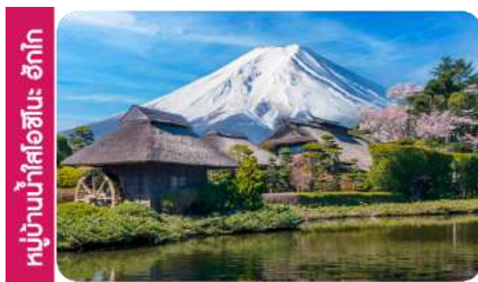
หมู่บ้านน้ำใสโอชิโนะ ฮักโก

เทศกาลชมดอกไม้ชิบะซากุระ (Shibazakura Festival) เป็นเทศกาลที่จัดขึ้นในช่วงฤดูใบไม้ผลิ เดือนเมษายนถึงพฤษภาคม โดยที่มีการจัดแสดงดอกชิบะซากุระ (หรือที่เรียกว่า "ดอกไม้มอส") ที่บานเต็มทุ่งหญ้า ดอกชิบะซากุระจะมีสีส้มหลากหลาย เช่น สีส้มพุ่ม ม่วง ขาว และแดง ซึ่งถือเป็นไฮไลท์ของในช่วงเทศกาลนี้ และจะได้เห็นทุ่งดอกไม้ที่กว้างขวางที่เรียงรายไปตามเนินเขาบรรยากาศที่สวยงามพร้อมกิจกรรมต่าง ๆ ให้ผู้เข้าชมได้เพลิดเพลิน เช่น การเดิน