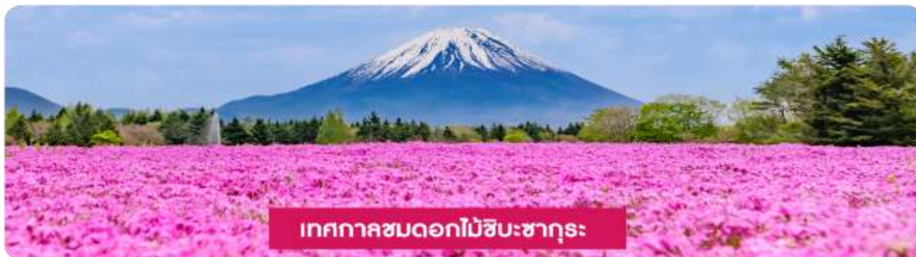
เทศกาลชมดอกไม้ชิบะซากุระ

เทศกาลชมดอกไม้ชิบะซากุระ (Shibazakura Festival) เป็นเทศกาลที่จัดขึ้นในช่วงฤดูใบไม้ผลิ เดือนเมษายนถึงพฤษภาคม โดยที่มีการจัดแสดงดอกชิบะซากุระ (หรือที่เรียกว่า "ดอกไม้มอส") ที่บานเต็มทุ่งหญ้า ดอกชิบะซากุระจะมีสีส้มหลากหลาย เช่น สีส้มพุ่ม ม่วง ขาว และแดง ซึ่งถือเป็นไฮไลท์ของในช่วงเทศกาลนี้ และจะได้เห็นทุ่งดอกไม้ที่กว้างขวางที่เรียงรายไปตามเนินเขาบรรยากาศที่สวยงามพร้อมกิจกรรมต่าง ๆ ให้ผู้เข้าชมได้เพลิดเพลิน เช่น การเดิน