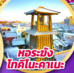
หอรบั้ง โทคิโนะคาเนะ