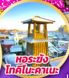
หอรบั้ง โทคิโนะคาเนะ