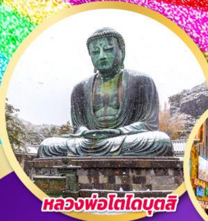
หลวงพ่อโตโตบุตสึ