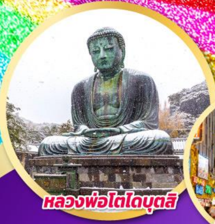
หลวงพ่อโตโตบุตสึ