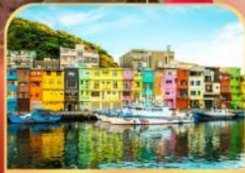
ท่าเรือประมงเจิ้งปิน